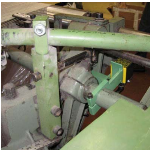
SENSORE SVOLGITORE telaio Saurer S400