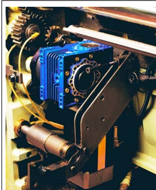
TIRAPEZZA DEL TESSUTO

Ergotron offre un servo-azionamento digitale per telai tessili, che può essere applicato come tirapezza del tessuto e svolgitore di ordito.